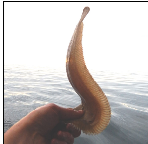
Réflexe « CAMBRE »