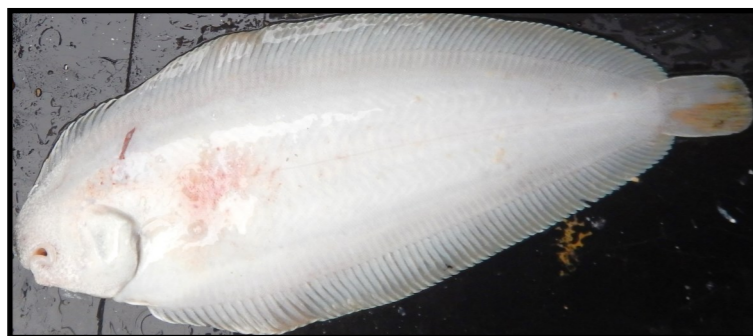
Blessure, catégorie « rougeurs »